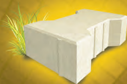
Катушка 80 мм