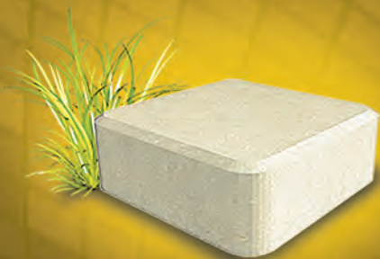
Классика 60 мм