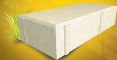
Брусчатка 60 мм