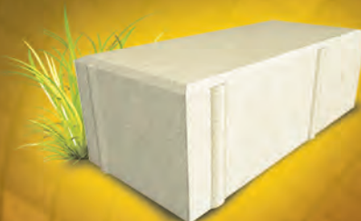
Брусчатка 80 мм